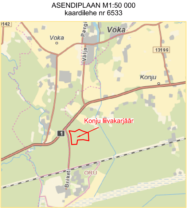
Konju liivakarjääri mäeeraldisel piiripunktid ja pindala